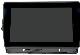
Monitor HD 10.1" touch-screen 4 canais com SPLITTER Com zoom