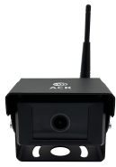
* Câmera wireless HD WIDE VIEW 170°