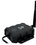
Receptor digital sem fio 2.4GHZ 720P