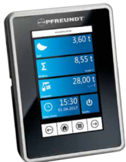
Eletrônica de pesagem