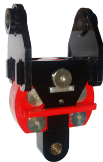
Elemento de medição BGW-1