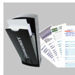
Comprovante de pesagem e caixa para armazenamento