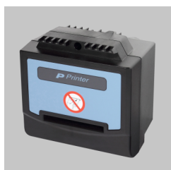
Impressora matricial multicamadas