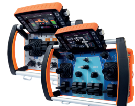
Spectrum M, Spectrum L e Spectrum G