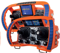
Technos A Technos B