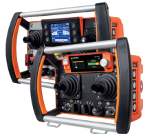
Spectrum A, Spectrum B Spectrum D e Spectrum E