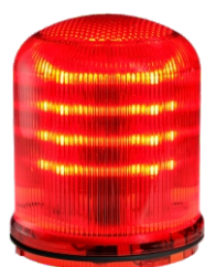
(90353) Cúpula FLR All Color