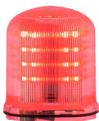
(90123) Cúpula FLR All Clear