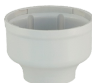
(90369) Base Pole