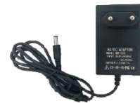
Carregador de bateria PLUG EURO (SKAD001)