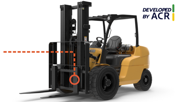
Suporte Universal para Laser e Câmera no porta garfo