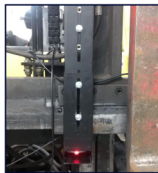
Suporte Telescópico universal para uso portátil (RD42SP100G1)