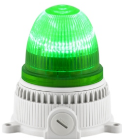
Ovolux Base M