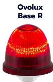
Ovolux Base R