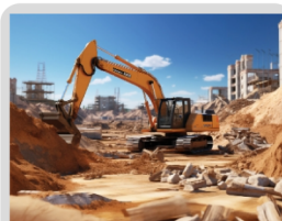
Canteiros de obras