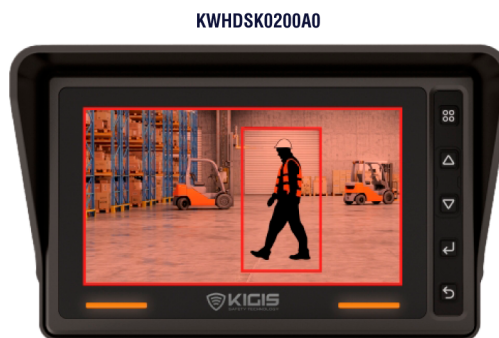
Monitor para sistema iVIEW+