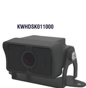
Câmera para sistema iVIEW+