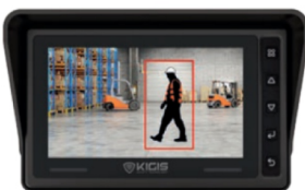
Box vermelho em torno de pedestre