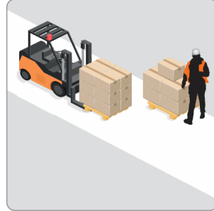
Visão de Pedestre Bloqueada