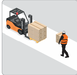
Pedestre Carregando Volume