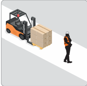
Pedestre Visto de Costas

O algoritmo de inteligência artificial presente nas CÂMERA COM IA é capaz de reconhecer a posição exata do pedestre mesmo em condições adversas.