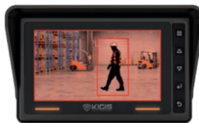
Alerta de LCD / LED com som de bipe