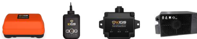
Kit Tag de Ponte