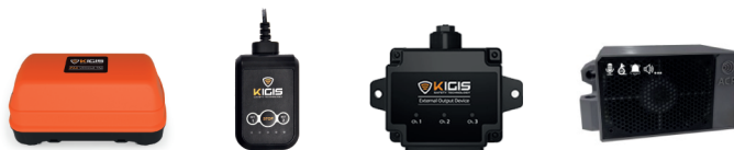
Kit Tag de Ponte