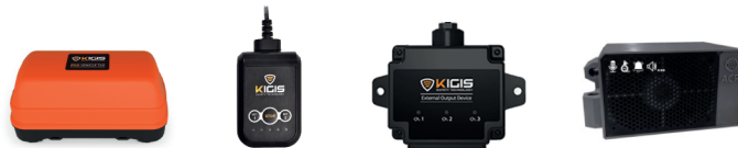
Kit Tag de Ponte