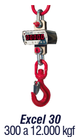
Excel 30 300 a 12.000 kgf