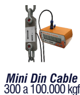
Mini Din Cable 300 a 100.000 kgf