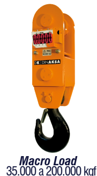
Macro Load 35.000 a 200.000 kgf