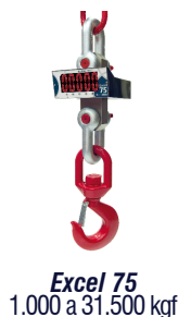
Excel 75 1.000 a 31.500 kgf