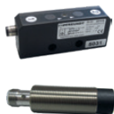
Sensores de proximidade