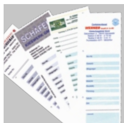
Comprovantes de pesagem