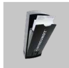
Caixa para comprovantes de pesagem