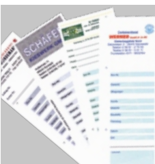
Comprovantes de pesagem