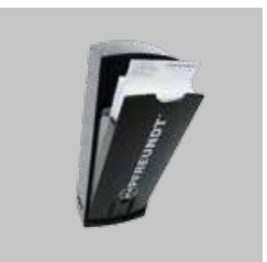
Caixa para comprovantes de pesagem