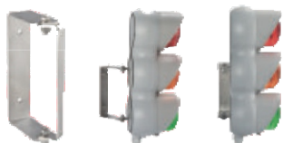
Suporte T-LINE para parede - 69784