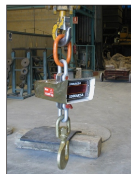
Excel 75 - Com proteção contra alta temperatura.