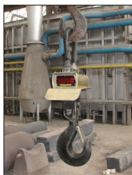
Excel 30 - Com proteção contra alta temperatura e Defletor.