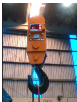
Macro Load - Para carga Granel