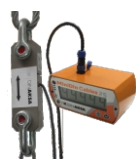
MINI DIN CABLE